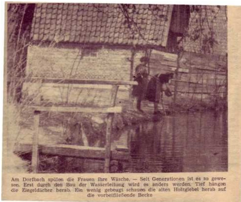
Am Dorfbach spülen die Frauen ihre Wäsche. — Selt Generationen ist es so gewesen. Erst durch den Bau der Wasserleitung wird es anders werden. Tief hängen die Ziegeldächer herab. Ein wenig gebeugt schauen die alten Holzgiebel herab auf die vorbeifließende Becke