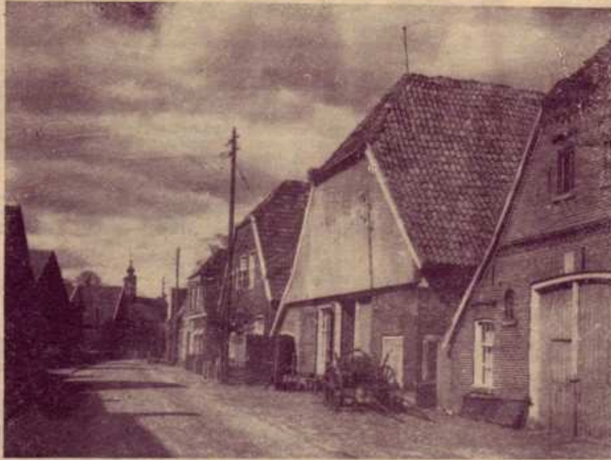
Mittagsruhe in der Dorfstraße von Lage. Hier scheint die Zeit stehengeblieben zu sein

Napoleon machte dieser Vorrangstellung im Jahre 1800 ein Ende. Karl der Große soll hier einst gegen die aufrührerischen Sachsen ein Bollwerk (Burg) errichtet haben. Sie wurde 1626 von den Holländern zusammengeschos-