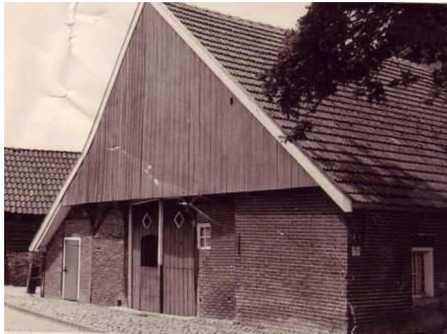
I Wohnhaus Tübbergen